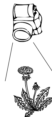
Photographie sur le plan vertical

Aussi il est intéressant de se focaliser sur des parties spécifiques de la plantes en les prenant en photo-macrographie (= en macro). C'est à dire à une distance de mise au point assez rapprochée de la plante pour mettre en valeur l'organe souhaité (fleur, tige, feuilles...).