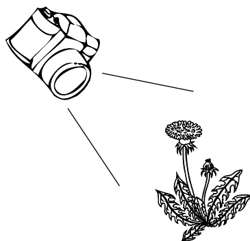
Photographie sur le plan oblique